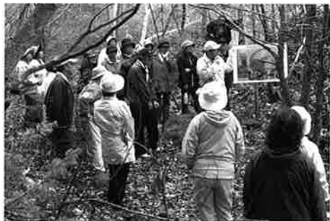
▲市民参加による現地見学会