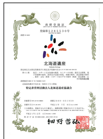
商標登録証第 5285530 号

観光庁関連事業や、緊急雇用事業、ふるさと雇用対策特別対策事業等の企画・助成金公募には積極的に応募をし、事業収入を得られるよう努める。