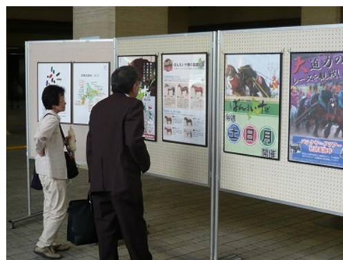
<北海道遺産パネル展(道庁 1 階)「ほっかいどう遺産 WAON」の PR も実施>