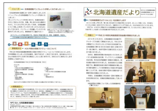
<北海道遺産だより>

手づくりのニュースレター「北海道遺産だより」を発行(年3回)。協議会の活動情報、地域の行事情報など。正会員・賛助会員・関係者等に送付した。