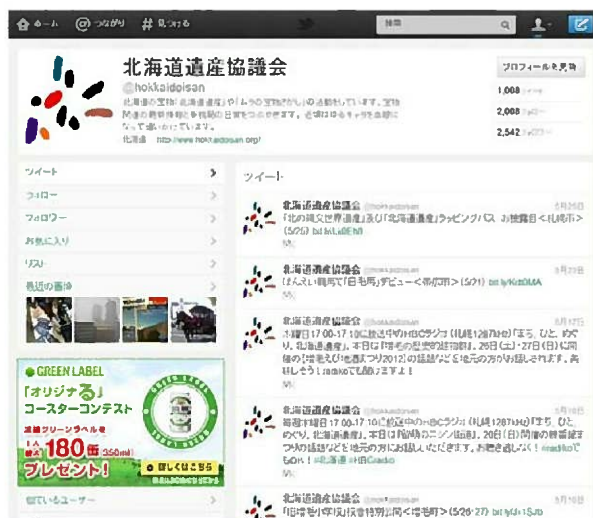
● twitter ページ

北海道遺産関連のイベント・トピック等の情報をホームページ、ブログ、twitter（フォロワー 2,602 名）メールニュース（登録数約 400 名）、facebook ページ（購読者 213 名）で配信した。