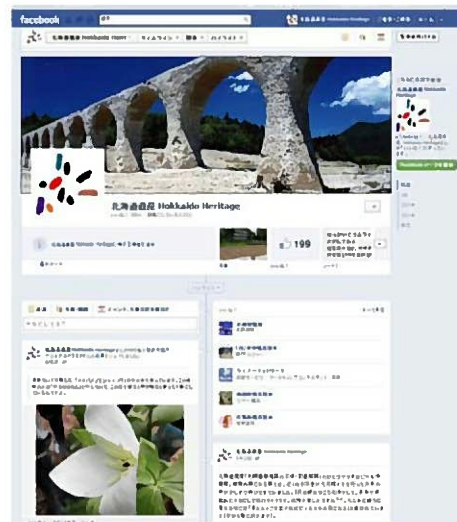
● facebook ページ