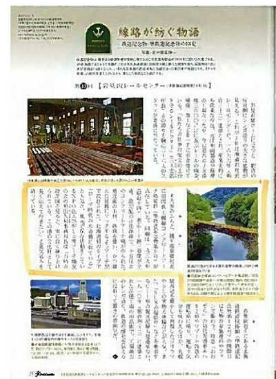
●JR北海道車内誌への記事掲載 (旧国鉄士幌線コンクリートアーチ橋梁群)