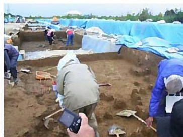
●対雁(ついしかり)2遺跡