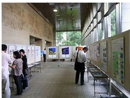
●北海道遺産10周年PR・ほっかいどうムラの宝物パネル展(道庁1階)