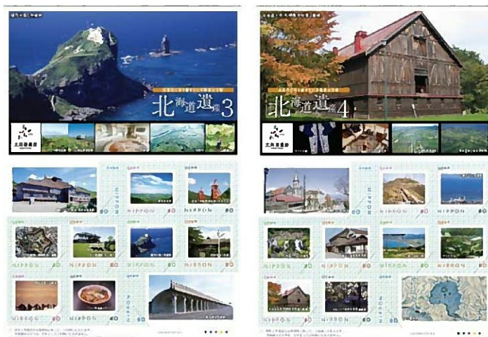
●北海道遺産フレーム切手 3、4