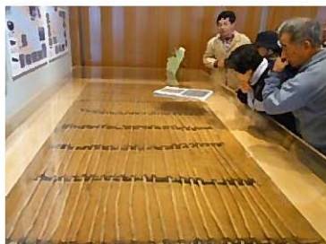
●いしかり砂丘の風資料館

◇株式会社シービーズアーズの協力で、北海道遺産を学ぶ旅「石狩川と縄文人の漁業を学ぶ」を開催。石狩川流域であり、漁労遺跡が発見された石狩市と江別市で、各市教育委員会学芸員から解説を聞き縄文人の文化を学んだ。