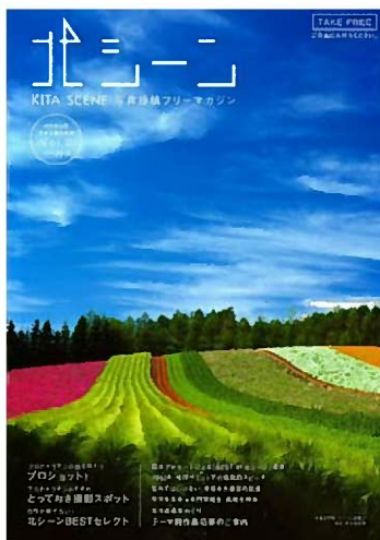
●『北シーン』北海道遺産めぐり