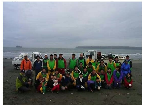
●伊藤園による積丹半島(8月)、霧多布湿原(10月)の清掃活動