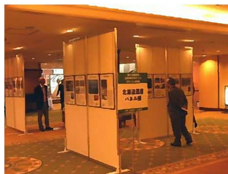
●「緑の分権改革サミット」でのパネル展示(札幌グランドホテル)