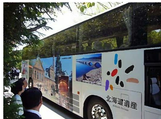
●北海道遺産ペイントバス(株)シービーツアーズ