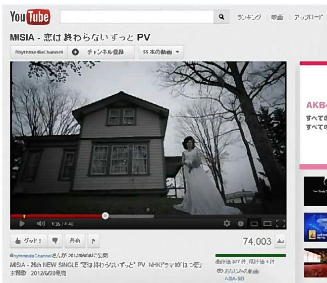
●音楽PV(MISIA)の撮影(ピアソン記念館)