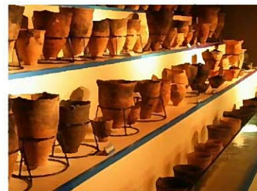
●江別市郷土資料館