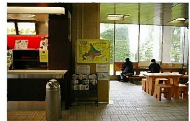
●HOKKAIDO MAP （道庁1階ロビーにて展示・配布）