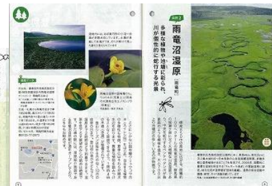
●道新ポケットブック～好評につき「オントナ」で今後 3 回ほど特集掲載予定