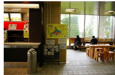
●HOKKAIDO MAP (道庁 1 階ロビーにて展示・配布)