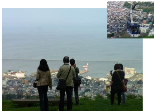
●ラストは天狗山山頂より防波堤を見る