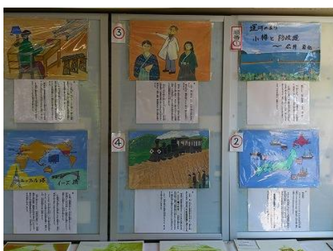
●紙芝居の中にもヒントが