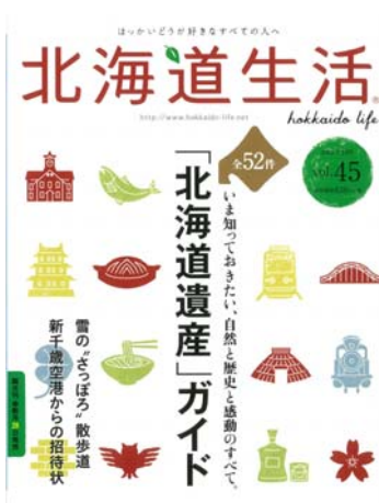
『北海道生活』50数ページにわたる北海道遺産の特集