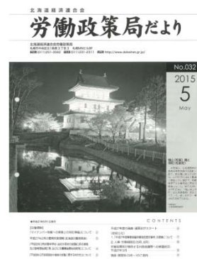
毎月表紙に遺産の写真掲載