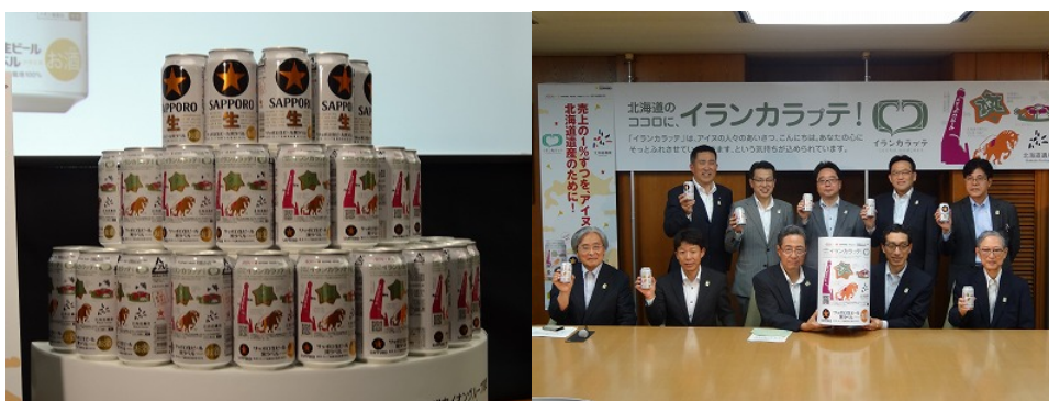
『サッポロ黒ラベル北海道遺産缶』北海道遺産数点がデザインされたサッポロ黒ラベルをイオン系列の店舗で販売、売り上げの一部をご寄付いただいた