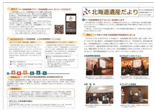
<北海道遺産だより>

手づくりのニュースレター「北海道遺産だより」を発行(年2回)。協議会の活動情報、地域の行事情報など。正会員・賛助会員・関係者等に送付した。