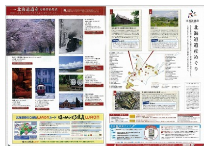
『Scene 北海道』遺産の公募写真掲載