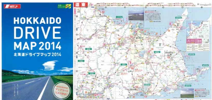
『北海道ドライブマップ』主な北海道遺産のアイコンを掲載