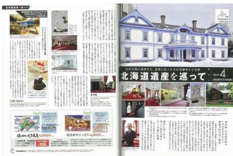
『北海道生活』シリーズで北海道遺産を紹介