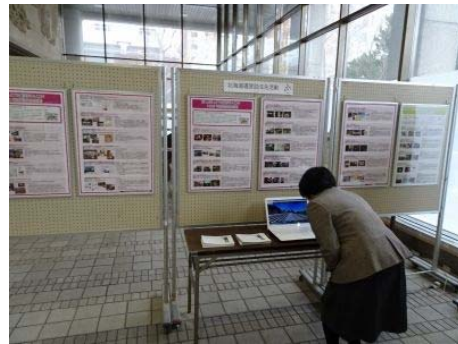
「北海道遺産パネル展」(8/15~17) 北海道庁1階ホール