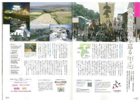
『JP01』本紙特集地域の北海道遺産を紹介

・『JP01』『じゃらん』『北海道生活』『Scene 北海道』『道内時刻表 2017』『web カイ』『2016年版 HOKKAIDO MAP 179 北海道市町村区域図』(NPO 法人日本自治アカデミー)