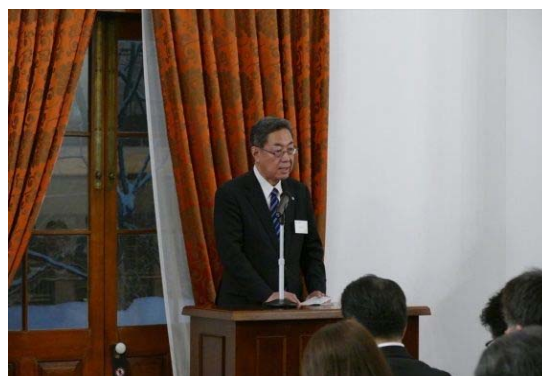
<来賓ご挨拶：山谷北海道副知事>