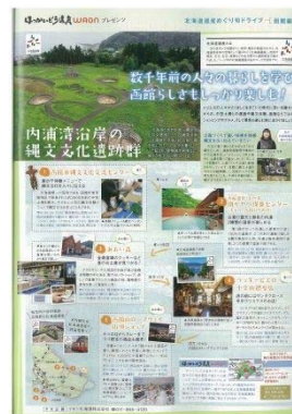
『じゃらん』北海道遺産を巡る旬のドライブコースの紹介