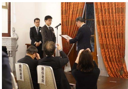
<「ほっかいどう遺産 WAON」寄付金・感謝状贈呈セレモニー>