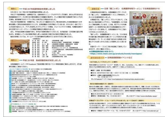
<北海道遺産だより vol. 18>