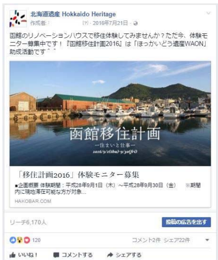
H28 年 7 月 21 日投稿 函館西部地区のリノベーションハウスの取組を紹介 (リーチ数 6, 170 人)