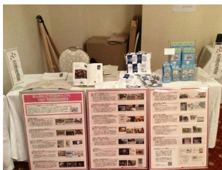
H28 年 11 月「全道しごとおこし・まちおこし情報交流会 2016」で販売