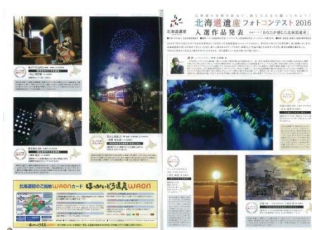
『Scene 北海道』フォトコンテスト写真掲載