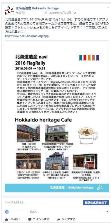
H28 年 10 月 30 日投稿 協議会事業の FlagRally を紹介 (リーチ数 4, 891 人)