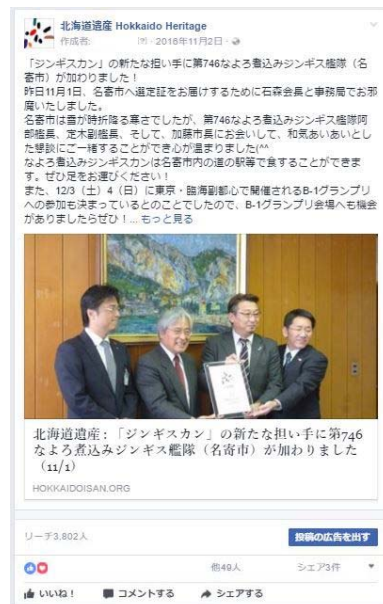
H28 年 11 月 2 日投稿 北海道遺産「ジンギスカン」の担い手について紹介 (リーチ数 3, 802 人)