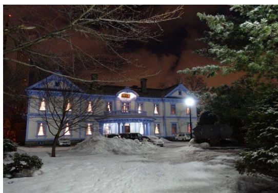
<会場：豊平館（北海道遺産）>