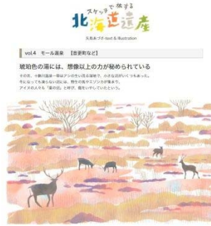
『web カイ』スケッチで旅する北海道遺産