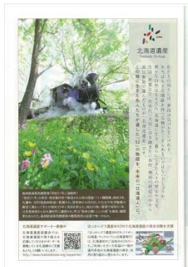
『道内時刻表 2017』雨宮 21号を紹介